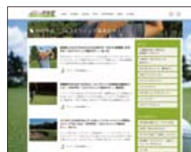
トヨタファイナンス カード会員向けWEBサイト 製作・運営