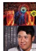
東京モーターショー パンフレット