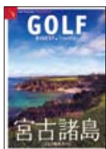
沖縄コンベンションビューロー ガイドブック

自社メディアに捕われず、様々なクライアントニーズに 応えたカスタム出版やオウンドメディアへのコンテンツ提供を実施