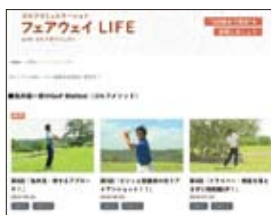
「野村不動産グループ カスタマークラブ」 WEBコンテンツ